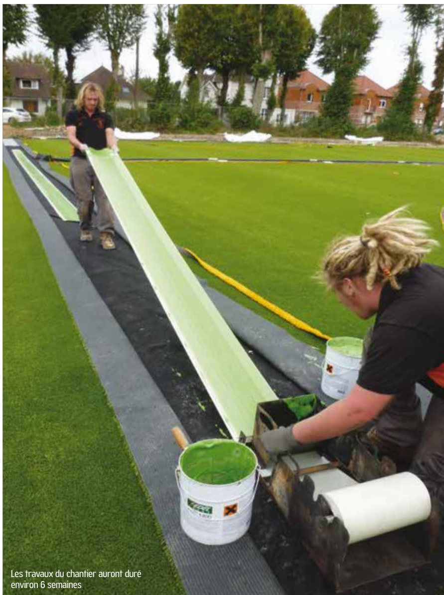
Les travaux du chantier auront duré environ 6 semaines

Grâce au Conseil général du Pas-de-Calais, le collège des sept vallées de Hesdin, ainsi que les primaires de la ville, vont disposer d'un plateau sportif multi-activités flambant neuf. Une réalisation très intéressante pour des établissements scolaires et qui pourrait se développer davantage à court ou moyen terme. ▶